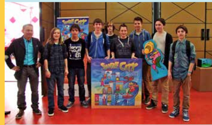
Acht zhavoleerlingen van het Maaswaal College wonnen met hun Power Tower het domein Water van de landelijke techniek- en kunstwedstrijd 'Arcadia, Imagine your future'.

Resultaten De inspectierapporten zijn goed. Maar met onze populatie leerlingen mag de ambitie wel wat omhoog, met name in vmbo-basis en vwo. Successen We werden voor het tweede achtereenvolgende jaar de tweede beste onderwijs-werkgever. We hebben zichtbaar een eigen positie in Wijchen. Stippen op de horizon Het schoolplan voor de komende vier jaar is klaar. We willen het gedachtegoed van Unesco veel verder vormgeven. Met ict willen we leerlingen meer en beter op maat bedienen. Nieuwe inzichten Wisselingen binnen de schoolleiding leverden nieuwe inzichten en ook kritische vragen op. Dat heeft zijn eigen dynamiek. Toekomst Door de krimp loopt bij ons het aantal leerlingen terug tot 80 procent van de huidige situatie.