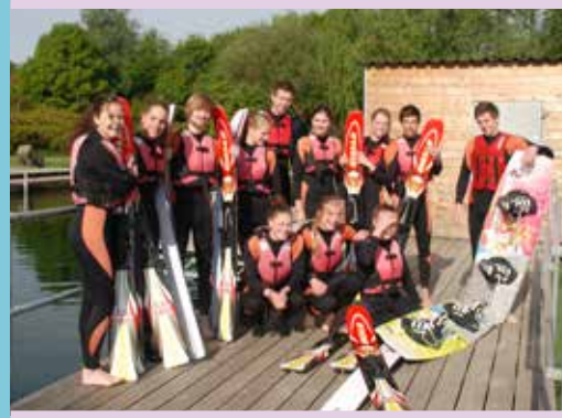
Leerlingen kunnen op het Mondial College kiezen voor het vak Beweging, Sport en Maatschappij.

Resultaten In de Inspectierapporten doen we het altijd goed. Vmbo-tl vraagt wat meer aandacht en dat heeft ook te maken met het feit dat die opleiding over twee locaties is verspreid. Dat wordt volgend jaar beter. Uit het dal De financiën beheersten het schoolgebeuren het hele jaar, maar het lukte ons in relatief korte tijd uit het financiële dal te komen. Docenten leverden hun bijdrage door binnen het taakbeleid tijdelijk een stap terug te doen ten aanzien van de vergoeding. De toekomst We beginnen met een nieuwe diepteprofilering voor ondernemerschap: het International Business College (IBC). Met technasium en IBC zijn we onderscheidend in Nijmegen en omgeving. Het vmbo is volledig gerestyled en als integraal vmbo uniek voor Nijmegen. Organisatie We pakken de professionalisering van het management op en ook dat zou een restyling kunnen gaan betekenen.