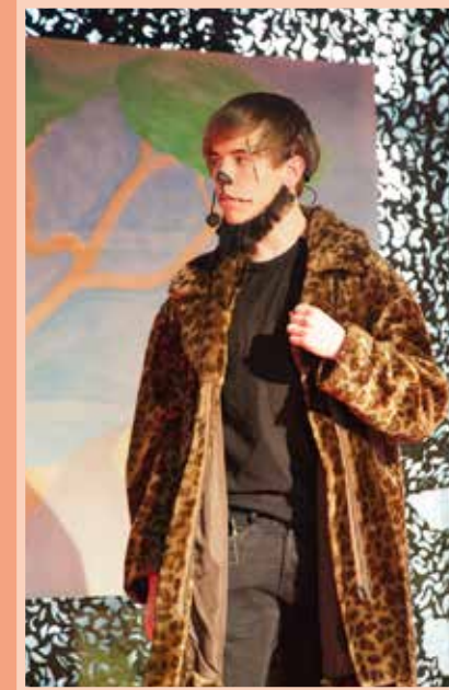
De opvoering van de musical The Lion King door leerlingen was een groot succes.

Stabiel We zijn gegroeid naar de school die we willen zijn en hebben nu een stabiele basis om op verder te bouwen. De jonge en dynamische docenten vormen de kracht van de school. De Dijkstraat werkt aan het pedagogisch-didactisch model Positive Behaviour Support (PBS). De bovenbouw richt zich op vaardigheden die bij ondernemen horen.